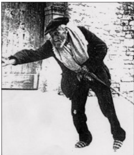
Poète... et bouliste

Il mourut le 20 juillet 1953 à l'âge de 83 ans.