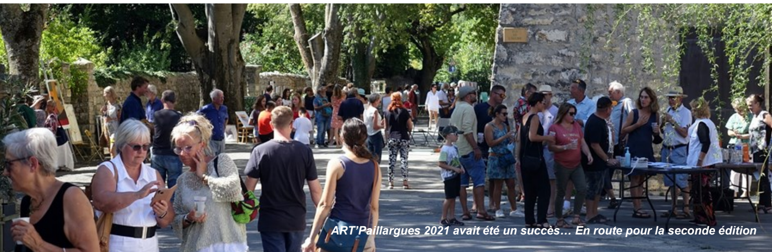
ART'Paillargues 2021 avait été un succès... En route pour la seconde édition