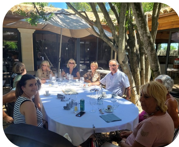
Le maire accueille les bénévoles

Un atelier informatique et numérique, ouvert à tous et sans rendez-vous, est également organisé chaque mardi matin de 9h30 à 11h30 , sans oublier les animations autour de la bibliothèque dont le programme est décliné au fil des mois.