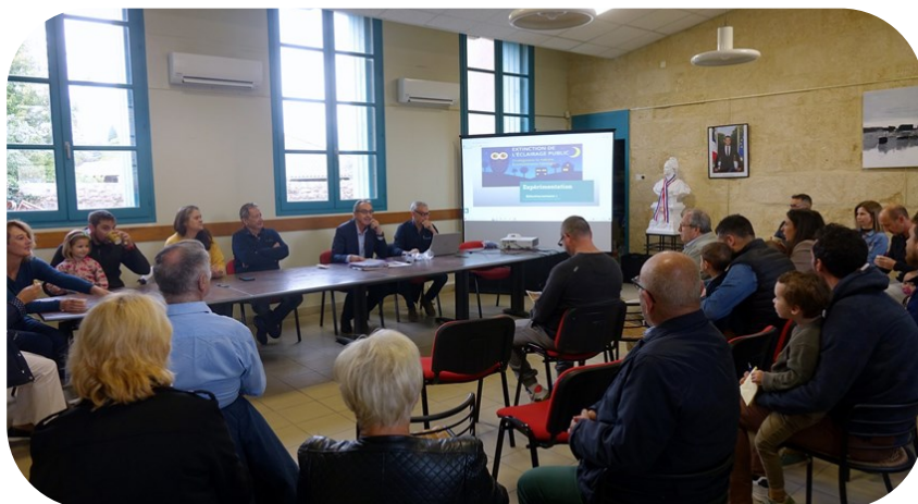
Accueil des nouveaux arrivants en 2022

Le petit déjeuner d'accueil pour les nouveaux arrivants se déroulera le 13 janvier 2024 , dans la salle du conseil municipal. Toutes les personnes concernées, habitants arrivés en 2022 ou en 2023 sur la commune, peuvent s'inscrire auprès du secrétariat de la mairie, pour y participer. La présentation des élus, du personnel municipal, des commerçants locaux et des installations municipales permettra d'échanger sur les différents sujets et de répondre aux questions de chacun.