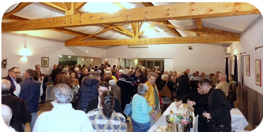
Retour sur la cérémonie de 2023, très suivie