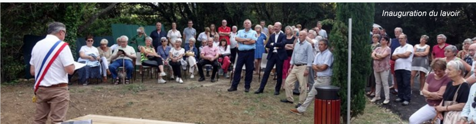
Inauguration du lavoir

La réfection de la croix près du château est à l'ordre du jour, mais le dossier administratif est complexe, cette croix ne faisant pas partie du patrimoine public. Un plan de rénovation d'Aureilhac reste dans l'attente, faute d'obtention de subventions. La réfection et la mise en valeur du beffroi est également lancée.