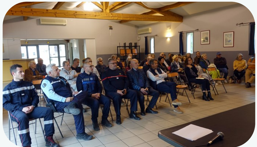
Les réunions publiques sont très suivies

Pour les mois à venir , nous étudions la possibilité d'installer un second panneau d'informations sur la place de la mairie. Notre réflexion sur l'édition d'une MAG uniquement informatique n'est pour l'instant pas retenue devant l'enquête d'opinion qui plébiscite la diffusion papier. C'est dans cette optique que nous avons opté en 2023, pour raison économique, de limiter la parution à 3 numéros au lieu de 4.