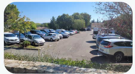
Les parkings de plus en plus utilisés