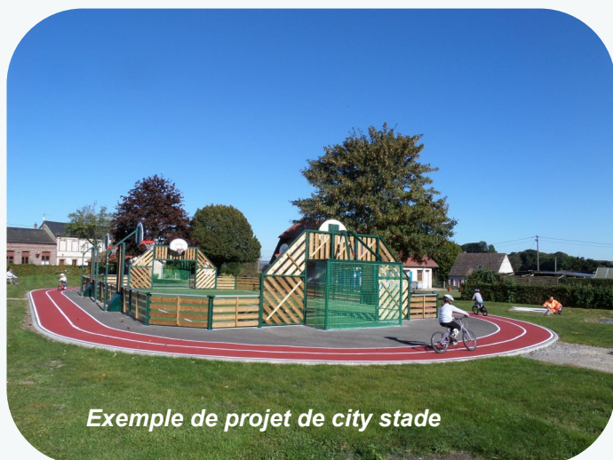
Exemple de projet de city stade

Projet lancé quelques semaines après l'élection, cette réalisation d'un city stade dans l'espace sportif du chemin de Mazel, devrait être terminée avant la fin 2023.