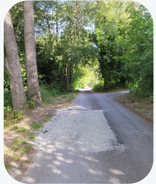
Le chemin des Seynes et le chemin de Fontèze, rénovés

Nos chantiers importants de ce début de mandat, aménagement lotissement Font Clarette, fin des travaux route de Blauzac et réfection du carrefour de la mairie se sont achevés début 2023.